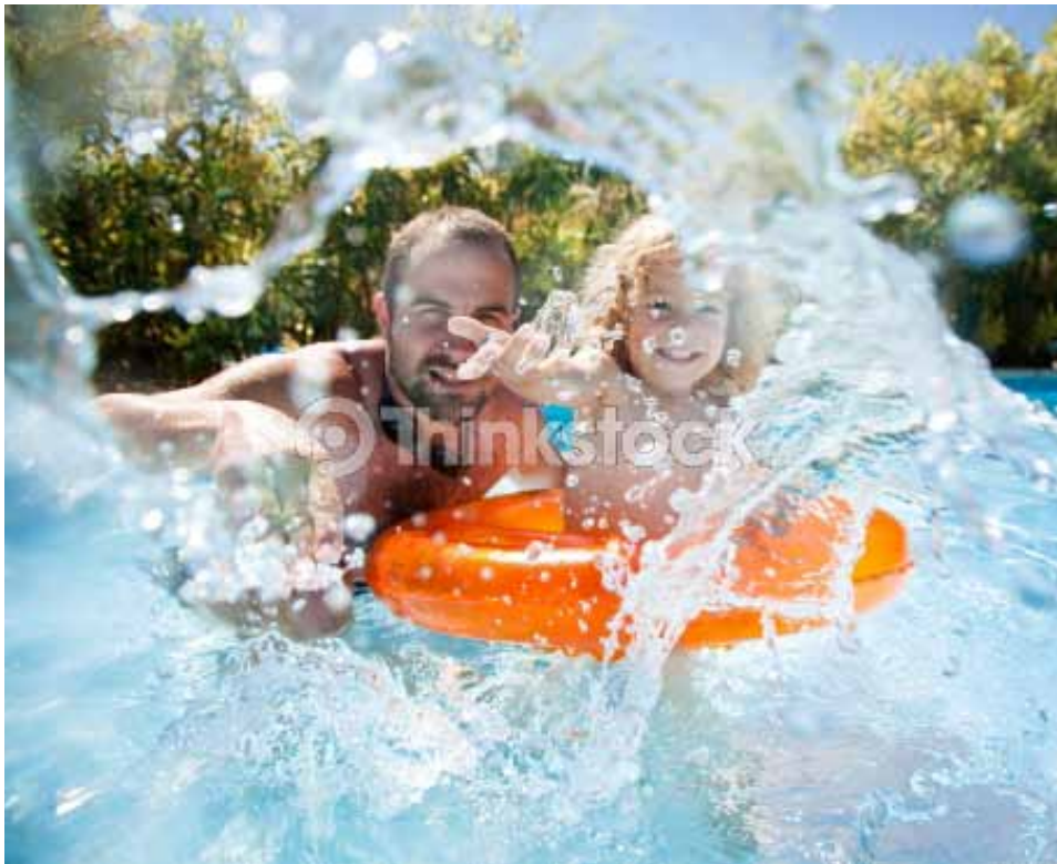
XXX - Les personnes photographiées ne sont pas concernées par le sujet de l'article.

Pas toujours facile de s'entendre avec son ex pour organiser les vacances des enfants. Des décisions de bon sens jusqu'au recours au juge, nos conseils pour éviter les malentendus. Et préserver l'intérêt des enfants !